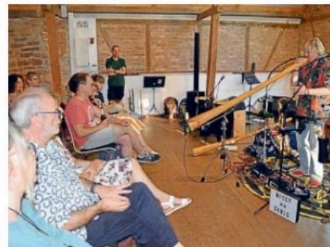
„Mundo-Art“ (links) und „Missy Canis“ mit Didgeridoo machten Musik.